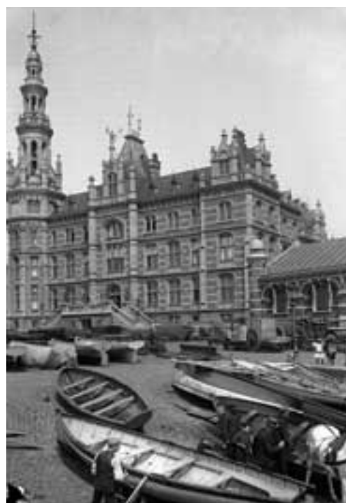
1930 - Het Loodswezen op Scheldekaai 25, helling Margueriedokje met roeiboten.