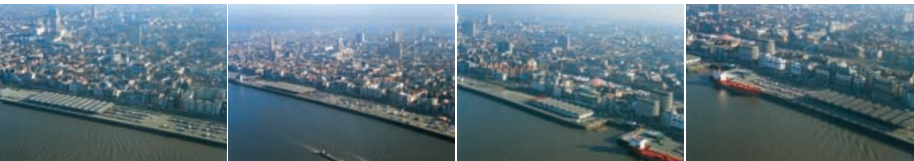
de Jordaenskaai, de Ernest Van Dijckkaai, de Plantinkaai, de Sint-Michielskaai, de Cockerillkaai, de De Gerlachekaai, de Ledeganckkaai ...

Tekst ontleend aan het Antwerps Stadsarchief (Gie Stappaerts, juni 2002).