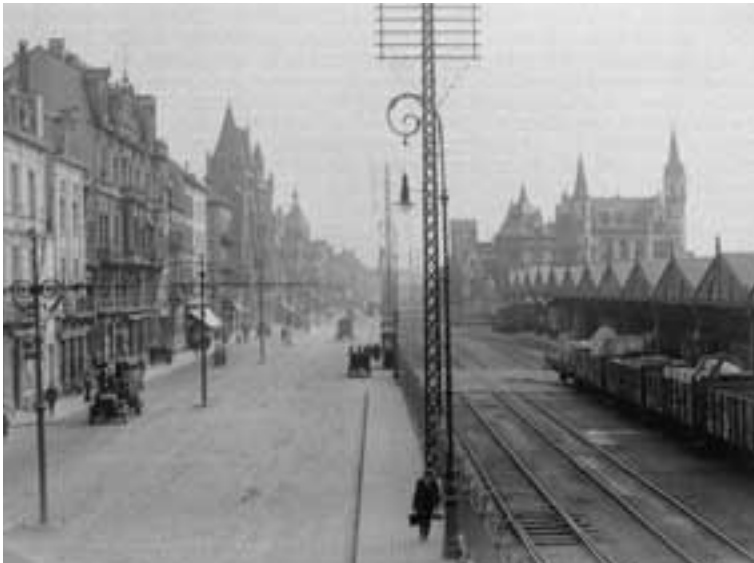
1923 – De steenweg Jordenskaai, vanaf de brug aan het Noorderterras richting Steen.