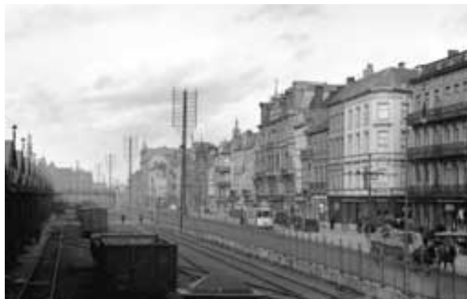
1923 - De steenweg Ortelius- en Van Meterenkaai, vanaf het Steen richting Loodswezen. Bemerkt de tram, treinwagons, paarden en karren.

Wellicht omwille van de naamsgelijkenis werd later de straatnaam Van Meterenkaai gegeven. Emanuel van Meteren (1535 - 1612), was een volle neef van Abraham Ortelius. Opgeleid voor de handel, ging hij al vroeg in Londen werken. In 1583 werd hij daar tot hoofdman van de Nederlandse kooplieden verkozen. Hij liet o.m. een "Belgische ofte Nederlantsche historie van onsen tijden" na, een kroniek van de gebeurtenissen tijdens de strijd met Spanje.