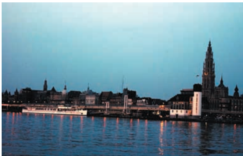
De 'lichtjes van de Schelde' vandaag, met rechts het Zuiderterras en de O.L.Vrouw-Katedraal...

Ook de Ledeganckkaai kreeg haar naam naar aanleiding van een 50ste verjaardag, die van het overlijden van Karel Lodewijk Ledeganck (1805-1847). Hij was o.m. dichter van de drie Zustersteden, gebruikte als eerste onze moedertaal in de Oost-Vlaamse provincieraad, vertaalde het burgerlijk wetboek en was samen met Jan Frans Willems één van de topfiguren uit de eerste periode van de Vlaamse Beweging. De kaaiweg