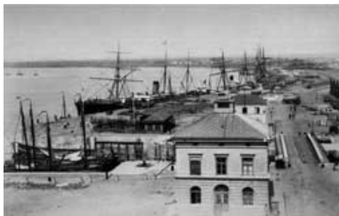
De nieuwe Rijnkaai en de Bonapartesluis, na het rechtekken van de kaaien.

De rechtekking van de Scheldekaaien rond 1880 en het bouwen van de Brialmontvesting rond 1860 hadden wél een grondige verandering aan het uiterlijk van de stad teweeggebracht. Bij die radicale ingrepen gingen zowel de hele toenmalige haven als de oudste stadskern onder de sloophamer. Aan het begin van die 19de eeuw was er nochtans reeds een ingrijpende herstructurering uitgevoerd, waarbij de eerste