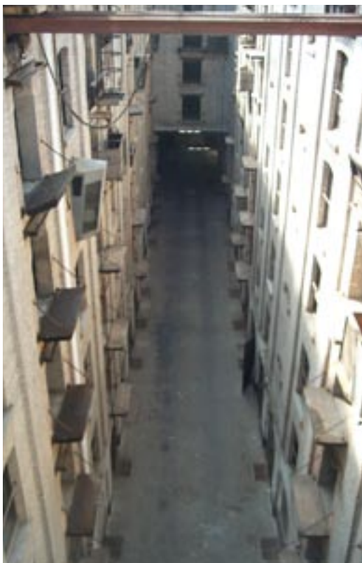
Uitzicht op de unieke binnenstraat van het Sint-Felixpakhuis.

dient aanvankelijk als verbinding tussen het Willemdok en de Oudeleeuwenrui. 'De Felix' is dus van oudsher behalve een opslag- en distributieruimte ook een verbindingsplek.