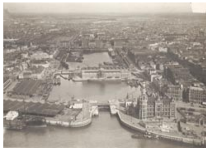
Luchtfoto van Het Eilandje. (1960)

Vanaf de jaren 1960 verkommert Het Eilandje stilaan. De havenactiviteiten verplaatsen zich meer en meer naar het noorden. Pas begin 21ste eeuw krijgt het oude kwartier een nieuwe toekomst en een nieuw elan. In 2002 keurt het stadsbestuur zowel het masterplan als het beeldkwaliteitsplan goed. Dat laatste bepaalt het uitzicht van het openbaar domein op Het Eilandje. Dat zal de komende jaren ingrijpend van gedaante veranderen.