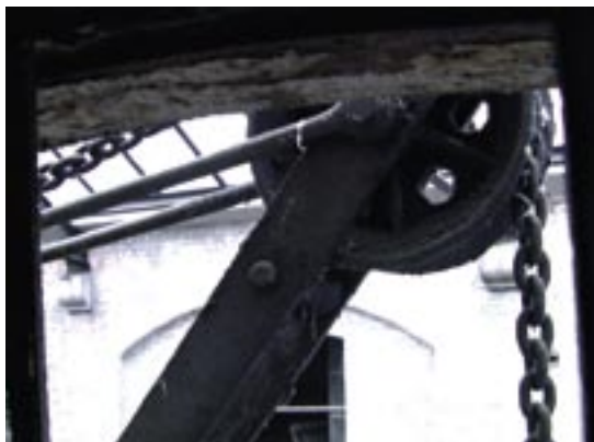
Een close-up van een hijsmechanisme in het Sint-Felixpakhuis.