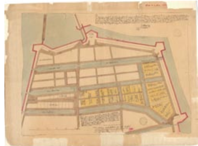
Plan van de Nieuwstad met erven, vlieten en straten.

In de jaren 1540 breidt Antwerpen zich nog eens uit en komt de zogeheten ‘Nieuwstad’ binnen de stadsomwalling. Het huidige Eilandje (nog lange tijd zonder de dokken!) is daar een onderdeel van. Met de nieuwe stadsgronden is de naam van Gilbert van Schoonbeke verbonden, een ondernemende Antwerpenaar die ook op stedenbouwkundig vlak zijn sporen heeft nagelaten.