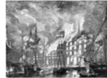
Gravure van de brand Sint-Felixpakhuis en raffinaderij De Viermolen. © JOSEPH VANHOOF SR., STADSARCHIEF ANTWERPEN (CA. 1862)

In de ovens van de aanpalende suikerraffinaderij De Viermolen (officieel de Raffinerie belge , nu het magazijn Michiels-Loos) ontstaat om zes uur 's avonds een brand die uitgroeit tot een reusachtige vlammenzee. De hele buurt wordt geëvacueerd en zelfs de brandweer van Mechelen komt te hulp. Het vuur slaat al snel over naar het Sint-Felixpakhuis, dat een gemakkelijke prooi blijkt voor de vlammen. Dat komt door het grotendeels ontbreken van binnenmuren.