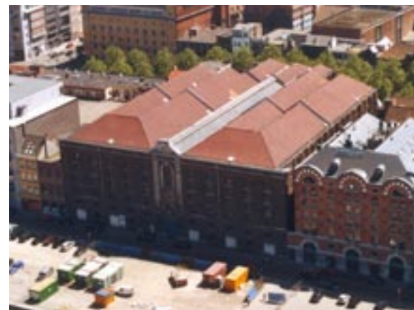
Luchtopname Sint-Felixpakhuis.