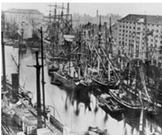
Luchtfoto van het Willemdok. © STADSARCHIEF ANTWERPEN (ca. 1900)