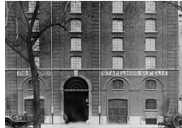
Een soldaat staat geleund tegen de gevel van 'De Felix'. © STADSARCHIEF ANTWERPEN (1940)

10 308 kg kaas 11 250 kg spek 31 710 kg reuzel 450 vaten pekelharing 5 819 kisten opgelegde groenten