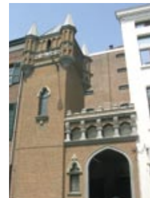
De gevel van het pomphuis aan de Oudeleeuwenrui.

In 1885 komt er aan de Oudeleeuwenrui 27 een apart pomphuis dat eruitziet als een neogotisch kasteeltorentje. De hydraulische centrale daarin voorziet het Sint-Felixpakhuis en andere pakhuizen van de nodige waterkracht om de hijsmachines en kranen te doen werken. Dat hijsmateriaal, geïnstalleerd door de stad en de spoorwegen, dient om de goederen sneller te kunnen behandelen en op de verdiepingen te stockeren. Het geheel wordt aangedreven via een ondergronds leidingennet.