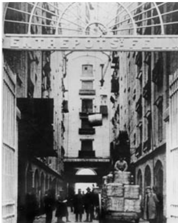
De douane controleert goederen in de binnenstraat van het Sint-Felixpakhuis. © STADSARCHIEF ANTWERPEN (1930)