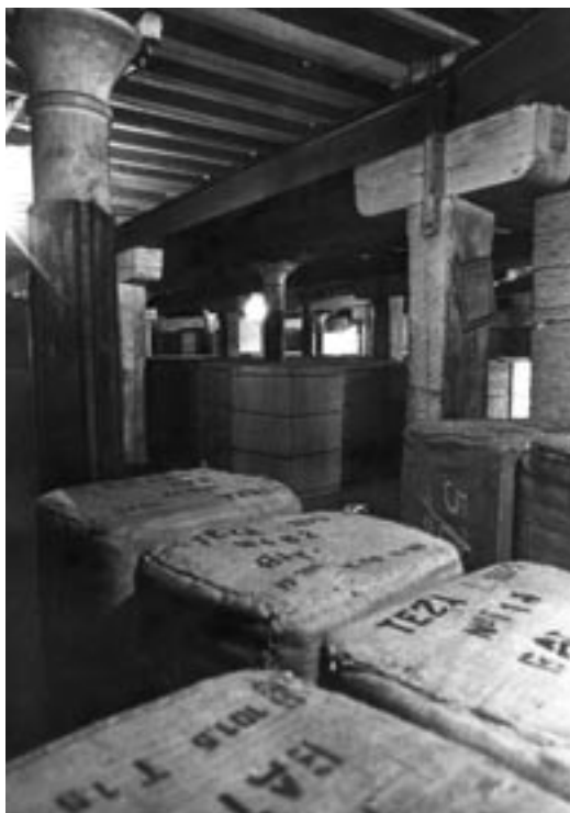
Balen tabak opgeslagen in de magazijnen van het pakhuis. © STADSARCHIEF ANTWERPEN (1960)