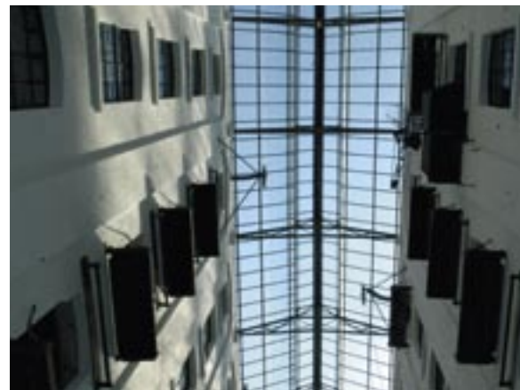
De gerestaureerde binnenstraat in kikvorsperspectief.