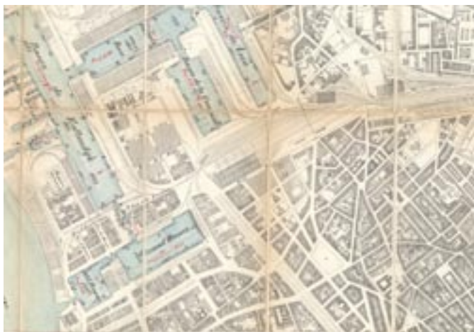
Detail uit een plan van de noorderdokken met links onderaan het Petit en Grand Bassin. (1908)